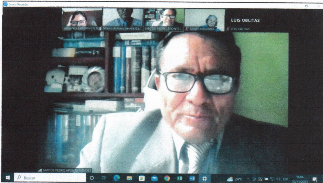
Foto de la sesión del Comité de Ética en la investigación del 30 de noviembre del 2023.